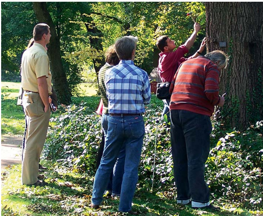
Die Baum-Akademie führt Fortbildungen und Prüfungen zum FLL-zertifizierten Baumkontrolleur durch. Hier ein Foto, welches während einer Prüfungssituation entstand.

Das von Wolf gesteckte Ziel, bis zum Jahr 2011 25 Prozent des Umsatzes durch langfristige Pflegeverträge zu erzielen, rückt mit großen Schritten näher. „Im