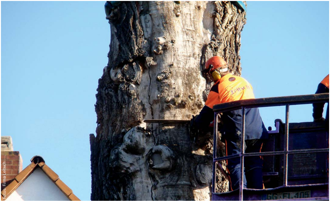
Eine Baumpflege-Kolonne der Firma Leitsch bei der Fällung einer alten Ulme mit Hubarbeitsbühne und Autokran.